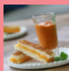
フィンガーサンド