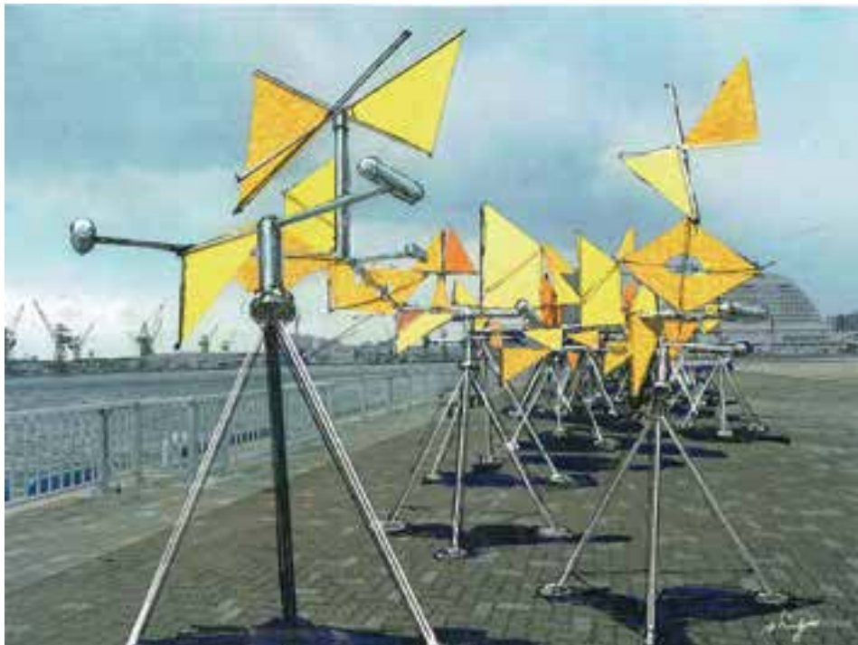
ウインドキャラバン 新宮晋 新港第一突堤