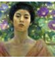
藤島武二《婦人と朝顔》 1904年個人蔵

近代洋画の巨匠であり、小磯良平の師である藤島武二の生誕150周年を記念した回顧展。初公開の作品や資料とともに藤島芸術の魅力を紹介する。