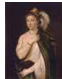
ティツィアーノ・ヴェチェッリオ 《羽飾りのある帽子をかぶった若い女性の肖像》1538年

エルミタージュ美術館の膨大なコレクションから精選されたオールドマスターの作品が勢揃いする展覧会。西洋絵画史に燦然と輝く巨匠たちの優品を堪能しよう。