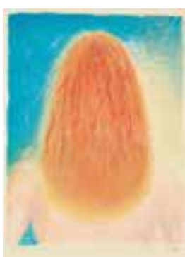
《Orange Headed》1983年 町田市立国際版画美術館蔵

神戸市灘区原田通3-8-30 アクセス 阪急「王子公園」駅から西へ徒歩約6分、JR「灘」駅から北へ徒歩約10分、阪神「岩屋(兵庫県立美術館前)」駅から北へ徒歩約12分 開館 10:00～18:00(会期中の金・土曜は20:00まで、入場は閉館の30分前まで) 休館 月曜(祝日の場合は翌平日) スタンプ 1階インフォメーション