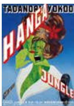
ポスター(デザイン:横尾忠則)