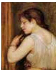
オーギュスト・ルノワール《髪を結う女》 1896年ユニマットコレクション

バルビゾン派のミレー、コロ、印象派のドガ、ルノワール、そして、エコール・パリのモディリアーニ、藤田嗣治などの西洋近代絵画と、ルネ・ラリックのガラス工芸の名品が一堂に会する。