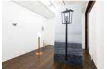
澤田華「Gesture of Rally #1705-01」

神戸市兵庫区新開地5-3-14 アクセス 「新開地」駅から徒歩約5分、JR「神戸」駅から徒歩約10分 開館 10:00～22:00 休館 火曜(祝日の場合は翌日) スタンプ 受付