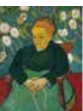
フィンセント・ファン・ゴッホ「子守唄、ゆりかごを揺らすオーキスティム・ルーラン夫人」1889年 Bequest of John T. Spaulding, 48.548

¥一般1,500円(1,300円)、大学生1,100円(900円)、高校生900円(700円)、中小600円(450円)