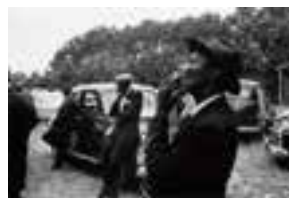
ロバート・フランク「葬式—サウスカロライナ州セント・ヘレナ」 「The Americans」(1959年)より © Robert Frank