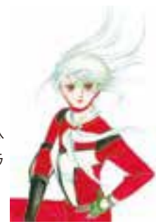
「スター・レッド」©萩尾望都/小学館

「ポーの一族」や「トーマの心臓」など不朽の名作を生み、日本の少女漫画史におけるSFの黎明期に活躍した萩尾望都のカラーイラストレーション、コミック生原稿など約400点のSF原画を展示。