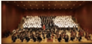
「市民の第九」より 毎年神戸文化ホールで開催される「市民の第九」では、一般市民から募った合唱メンバーが、オーケストラやプロの歌手のみならず、大ホールの晴れやかな舞台上で共演しています。

変わります。無伴奏のア・カベラからピアノ伴奏、オーケストラをバックに歌う壮大なステージまで、楽曲も宗教音楽からオペラや合唱を伴う交響曲、合唱曲、日本の歌曲やポップスなど実にバリエーション豊か。 さらに、合唱は音楽を本格的に勉強したことがない人や、楽器が弾けない人でも楽しめるのが特徴です。仲間と一緒に練習して、声が出るようになったり、美しいハーモニーで歌えた時の喜びはひとしおです。