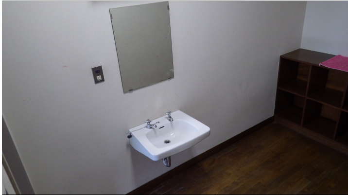
脱衣所・シャワールーム