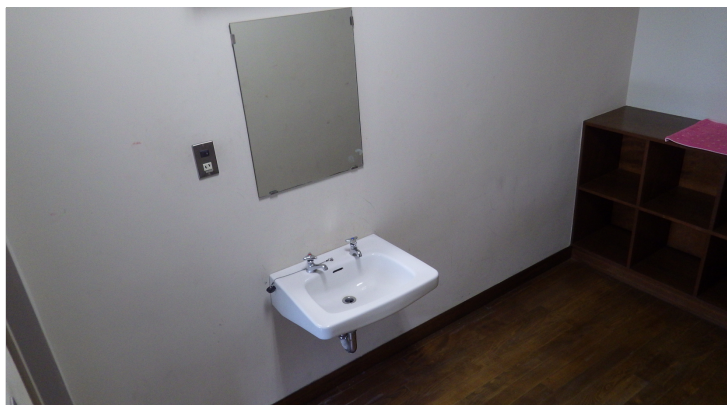
脱衣所・シャワールーム