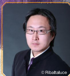
[テノール] 櫻田 亮