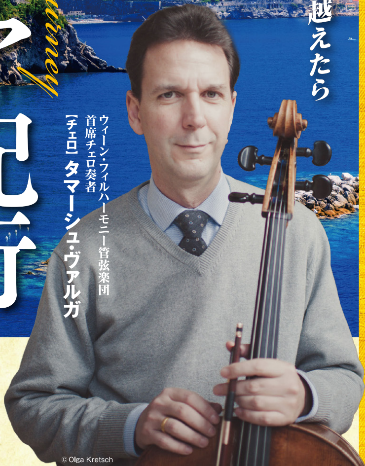
ウィーンフィルハーモニー管弦楽団 首席チェロ奏者 【チェロ】タマーシユ・ヴァルガ