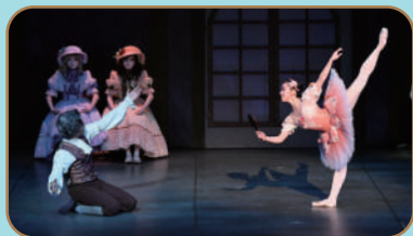
公演写真/撮影:岡村 昌夫(テス大阪)

原作/E.T.A.ホフマン 原振付/A.サン＝レオン 音楽/L.ドリーブ 【スタッフ】 団長・副団長/貞松 融・浜田容子 総監督/堤 悠輔 演出・振付/貞松正一郎