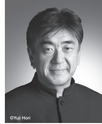
監修協力 佐渡 裕 からのメッセージ

神戸女学院大学音楽学部声楽科卒業後、パリ国立高等音楽院を首席で卒業。フランス歌曲や日本歌曲、ミサ曲等の宗教音楽、オペラなど幅広い分野で豊かな音楽性と高度の歌唱技術をもつのが国では少ないアルト歌手として高い評価を受けてきた。バルセロナ国際コンクール「フランス音楽賞」、大阪文化祭賞奨励賞、ブルー・メール賞、神戸市文化賞、兵庫県文化賞を受賞。