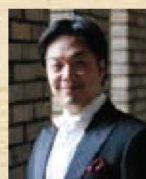
清水 徹太郎 (テノール)