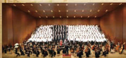
神戸文化ホール第九合唱団& 神戸フィルハーモニック