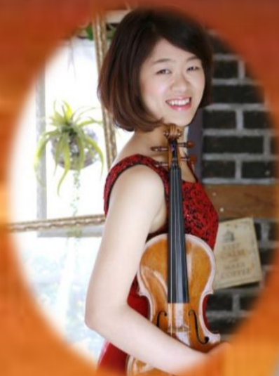
宮田 英恵 ヴァイオリン