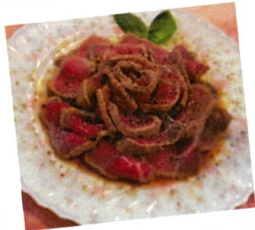
醬蕈のローストビーフ