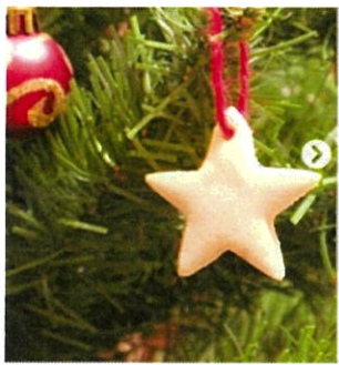
オーナメントクッキー