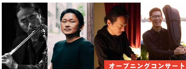
オープニングコンサート

多様な文化が港(ポート)から入ってきた神戸。その神戸の新たな文化発信拠点(ポート)としての役割を担う神戸文化ホールを中心に様々なジャンルの音楽と、神戸の人を繋ぎ「音楽のまち神戸」を発信します。