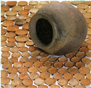
祇園遺跡第2次調査出土の渥美焼壺とかわらけ

古代からの港、大輪田泊を見晴らす高台の地平野は平安時代末、平清盛が別荘を営み後に移り住んだ土地です。