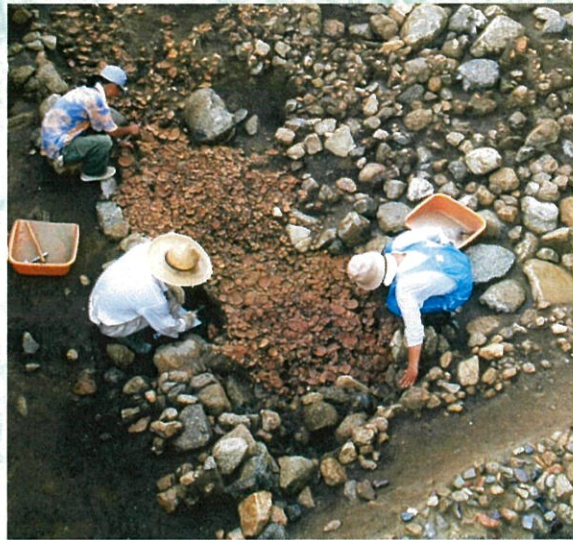
祇園遺跡第2次調査 園池から出土した大量のかわらけ