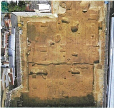
祇園遺跡第14次調査で確認された邸宅跡