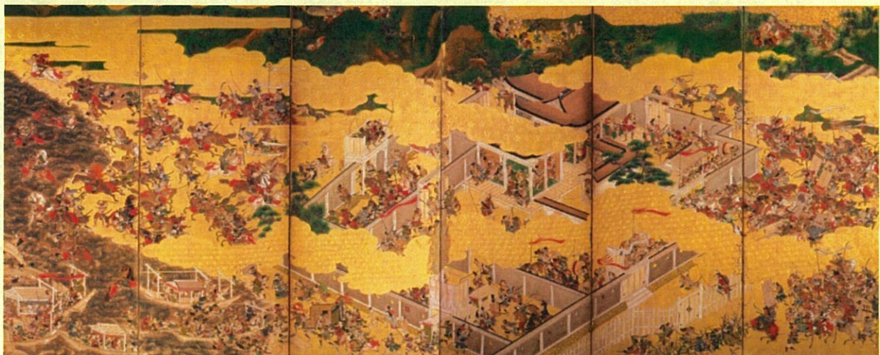
源平合戦図屏風 一の谷合戦図 17世紀 狩野吉信筆 神戸市立博物館蔵

モダンでハイカラな港町・・・、そのようなイメージを持たれがちな、私たちが住む神戸ですが、古く長い歴史が伝わる地域でもあります。中でも、800年以上前の源平合戦に関する史跡は市内のあちこちで見られ、神戸が争乱の舞台であったことを今日まで伝えています。講座では、それらがどのように造られ、伝えられ、人々にどう受け止められてきたのか、神戸市立博物館や地域に残る資料を用いながら、紐解いていきます。