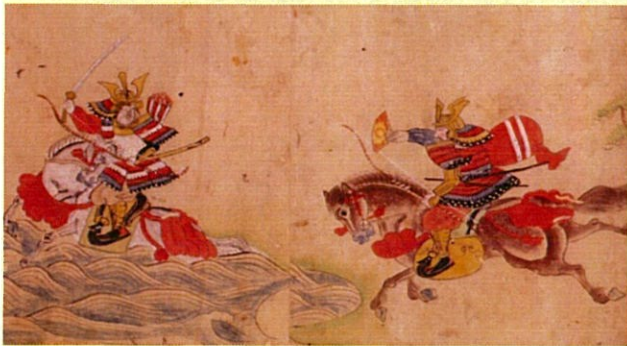
小敦盛絵巻 安土桃山時代 16世紀 神戸市立博物館蔵

モダンでハイカラな港町・・・、そのようなイメージを持たれがちな、私たちが住む神戸ですが、古く長い歴史が伝わる地域でもあります。中でも、800年以上前の源平合戦に関する史跡は市内のあちこちで見られ、神戸が争乱の舞台であったことを今日まで伝えています。講座では、それらがどのように造られ、伝えられ、人々にどう受け止められてきたのか、神戸市立博物館や地域に残る資料を用いながら、紐解いていきます。