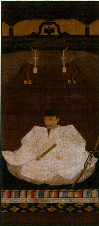
豊臣秀吉像 桃山時代、17世紀初期 神戸市立博物館蔵