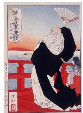
平相国清盛 月岡芳年画