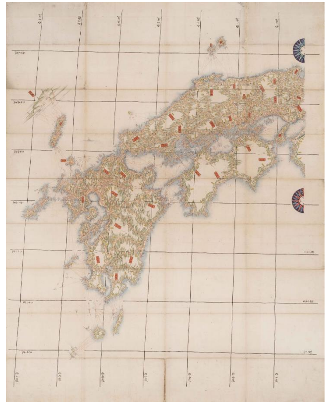
伊能小図西日本 文政4年(1821)頃 神戸市立博物館蔵