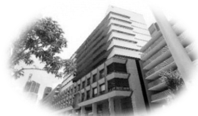
中央区文化センター