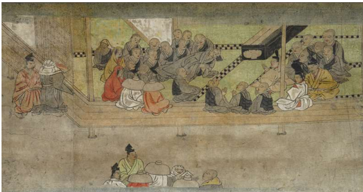
一遍上人絵伝断簡 南北朝時代 神戸市立博物館蔵

本講座では、それらの記憶を、兵庫に息づく御仏（みほとけ）や、兵庫ゆかりの人物に焦点をあてながら、探っていきます。