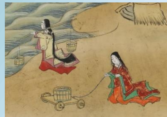
『絵入謡本 松風』より

場 所：神戸市立中央区文化センター 10階 会議室 1001+1002 受講料：1,500円（1回のみ）、5,000円（4回通し）※テキスト代別途